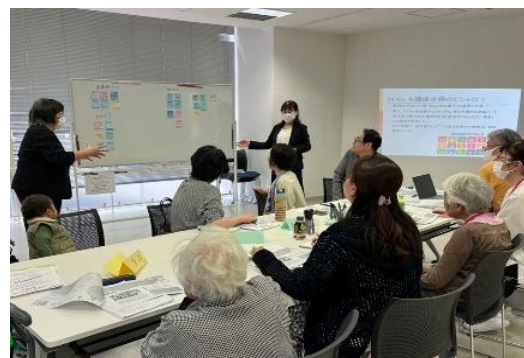
地域の課題から企画を考え、最終日には プレゼンテーションを体験します